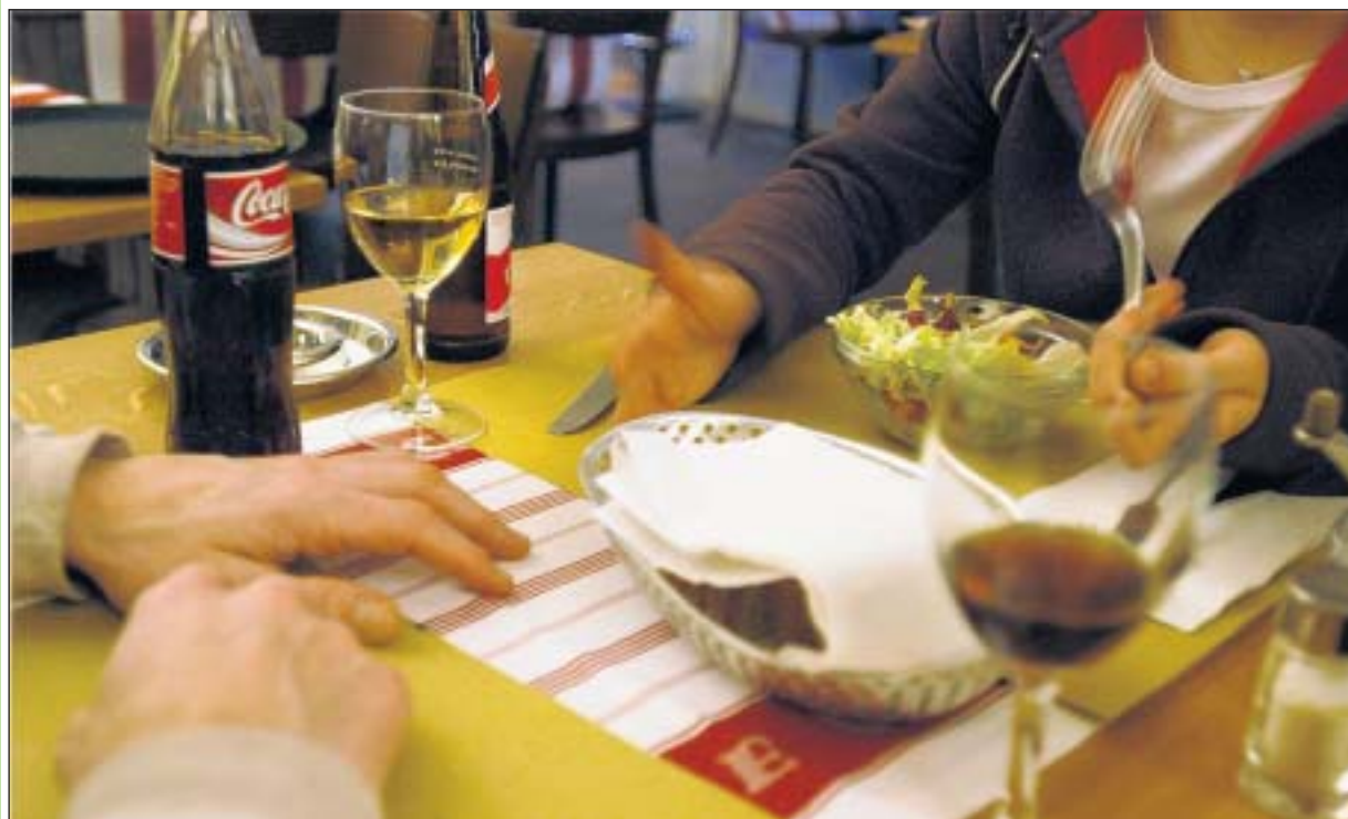
Per Mausclick den Partner beim Mittagessen finden: Eine neue Internetplattform macht theoretisch möglich.